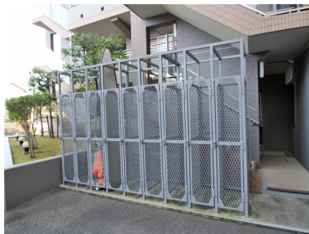
サーフボード置場