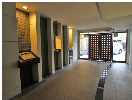
エントランス内部