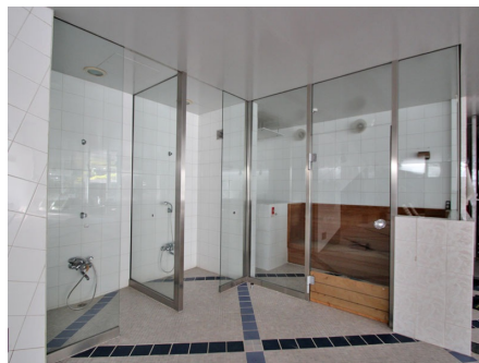
サウナ・シャワールーム