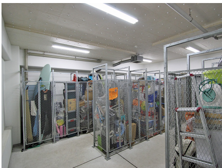
トランクスペース