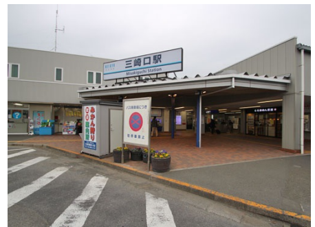
徒歩2分の京急三崎口駅