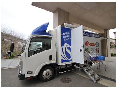
サービス付高齢者向け住宅とクリニックが併設