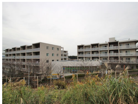
徒歩2分の京急三崎口駅