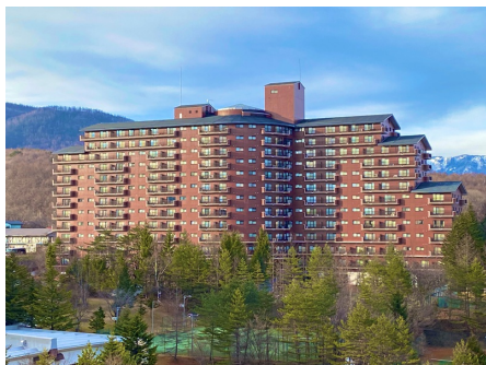
アドリーム草津 外観