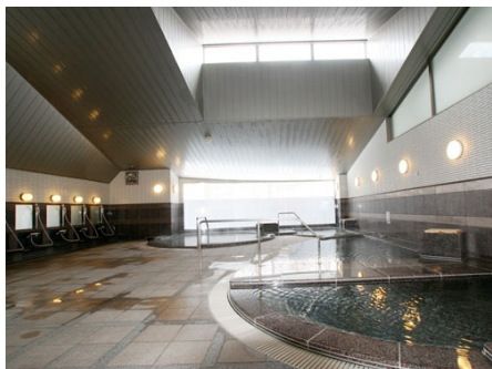
温泉大浴場 H24年12月改修工事済み