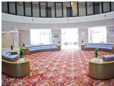
吹き抜けで、ゆったりくつろげるロビー