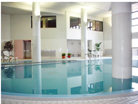
温水プールは通年利用可能です