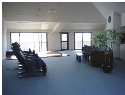
展望ラウンジからは浅間山を一望