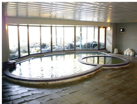
温泉大浴場 サウナ付き