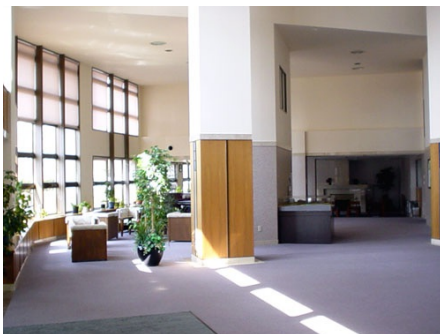
採光のとれたエントランス