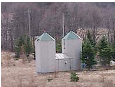
敷地内源泉から温泉を引いています