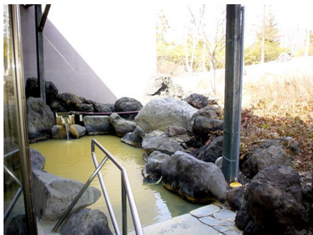
温泉露天風呂もあります