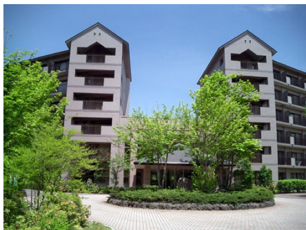
グランナチュール浅間高原 外観（秋）