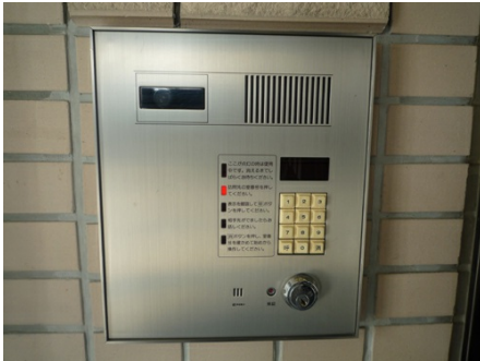
オートロック 24時間