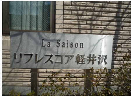
マンションエンブレム