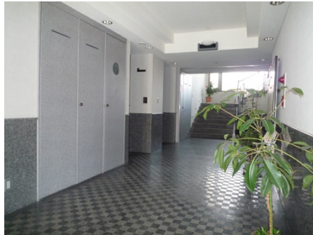
明るいロビー周り