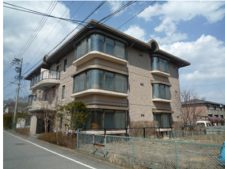
外観は低層で落ち着いた雰囲気