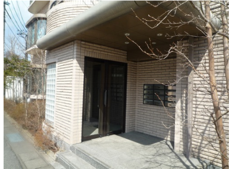
エントランス外観