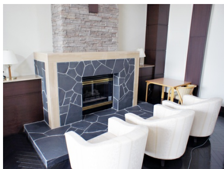
暖炉を囲んでおくつろぎ下さい