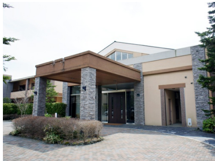
メインエントランス