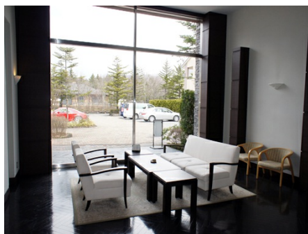
ラウンジでゆっくりと