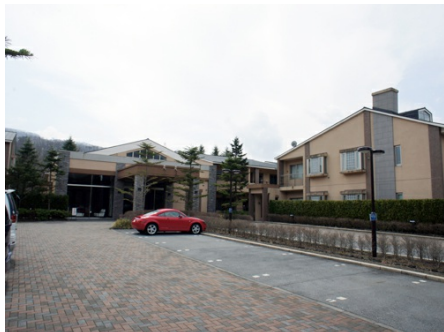
東急リゾートヴィラ軽井沢グランフェリエ 外観