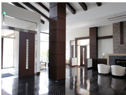
エントランスロビー