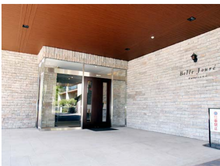
メインエントランス