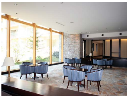
高級感のあるロビー