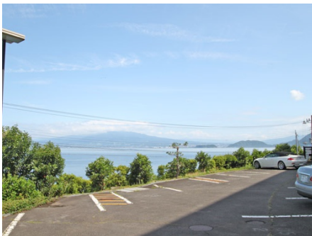
敷地内・平置駐車場