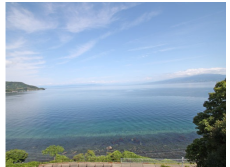
共用廊下からの眺望