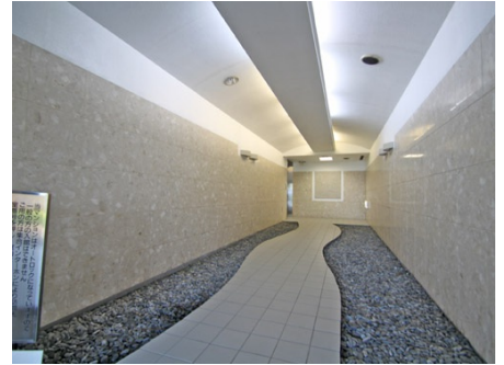
インナーエントランス