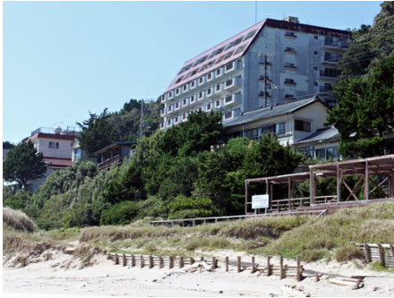
白浜中央海岸から