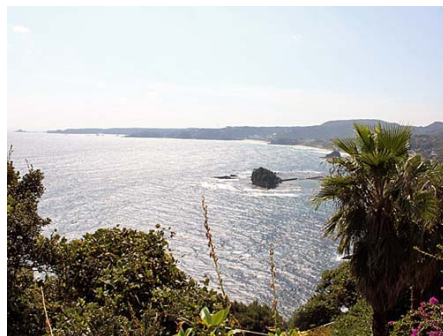
尾ヶ崎ウイングまで7.3キロ 車で13分