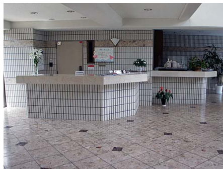
ホテルの様なフロントロビー