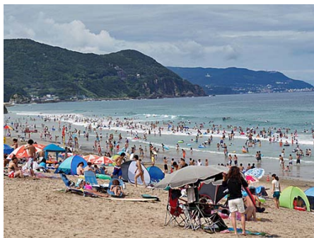
白浜まで3.5キロ 車で約7分