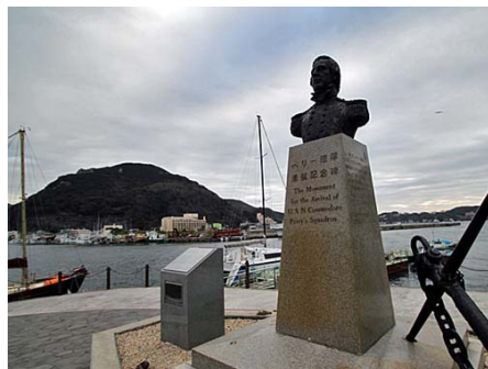
下田港まで2キロ 車で約5分