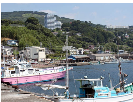
港からフレールを望む