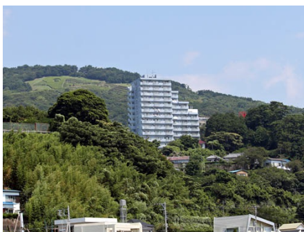
役場からフレールを望む