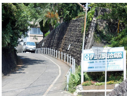
道路向かいの伊豆東部総合病院(徒歩2分)