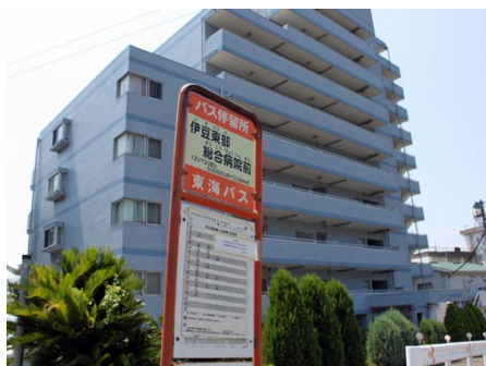
バス停とフレール伊豆稲取(バス停徒歩1分)