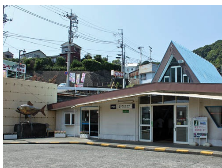
最寄りの伊豆稲取駅(約1.3km)