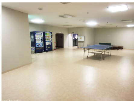
大浴場前の卓球台と自動販売機