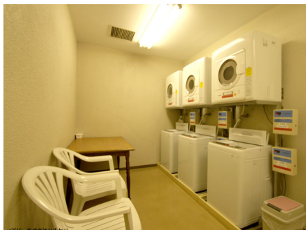
コインランドリー