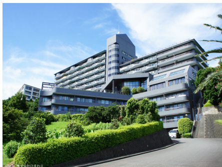
コートヴィラ熱川 外観