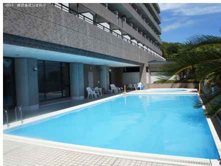
クアプール(夏季のみ)