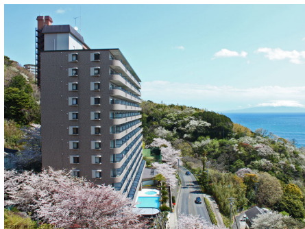
国道から見る外観