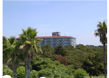
緑に囲まれたスカイリゾート