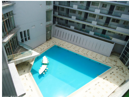
ロビーよりプールを見下ろす