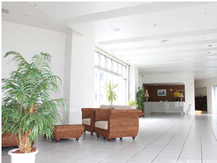
リゾートらしいロビー