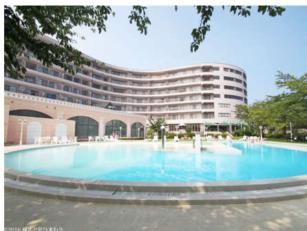
プールからのザグラン伊豆高原