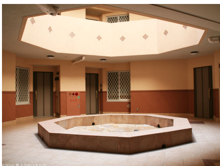
マンション中央の吹き抜け