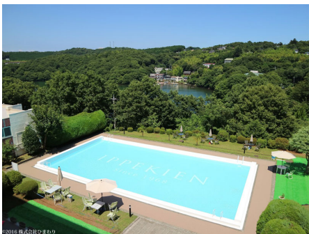
リニューアルされたプール