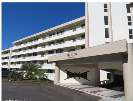
リニューアルされた外観