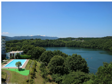
B棟より一碧湖を望む