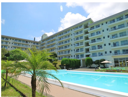
プールから見る一碧苑マンション