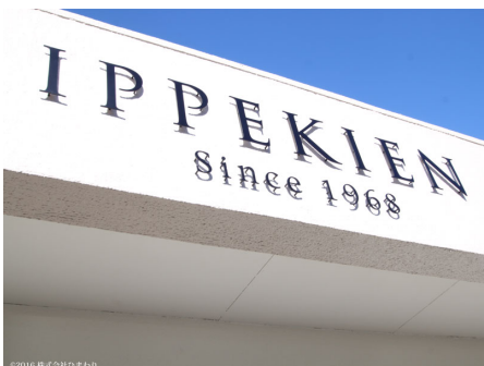
新しくなったエンブレム