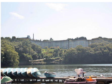
一碧湖よりマンションを望む