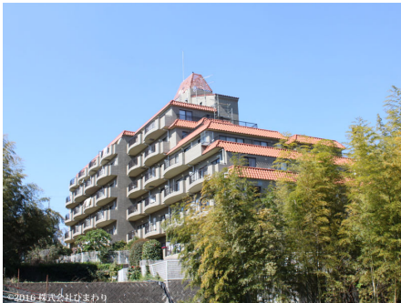
青空に映えるニューステージ