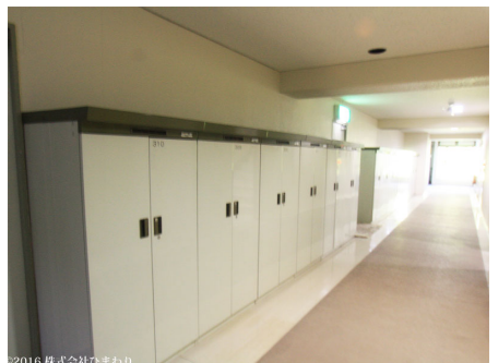
各部屋 ロッカーあり