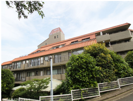
リゾートマンションの風格