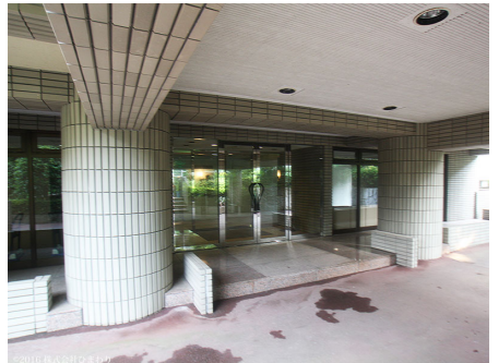
セキュリティ万全 オートロック