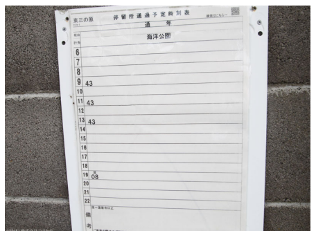
伊東駅から4便 海洋公園行