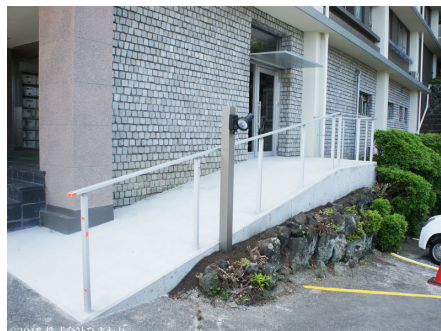
スロープも新たに設置