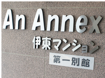
リニューアルされた第一別館