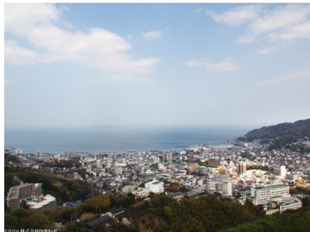
マンションからの眺望