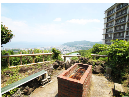
海を眺めながらのBBQコーナー