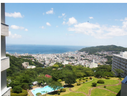
マンションからの眺め