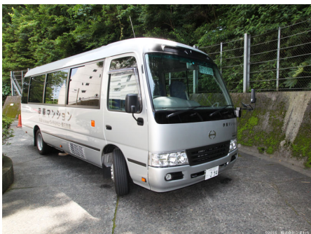
送迎マイクロバス (マンション～伊東駅)