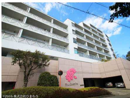
ヒルコート伊東外観