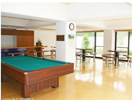
パーティールーム