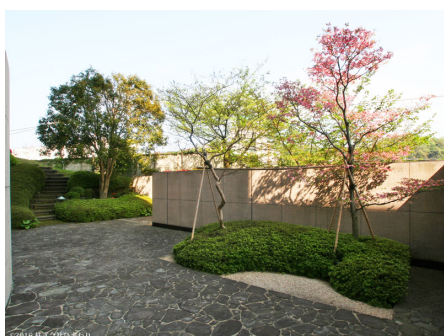
落ちついた敷地内