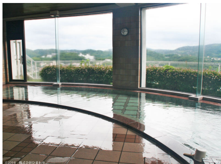
種類豊富な温泉大浴場