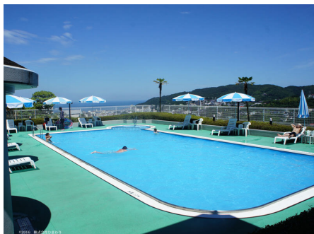
相模湾と大室山を見晴らすプール