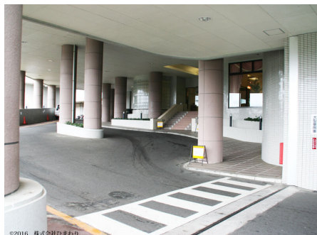
車寄せのあるエントランス