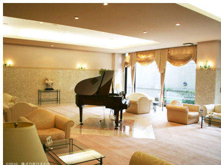
グランドピアノがあるロビー