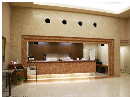
フロントも雰囲気があります