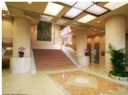
天井が高く高級感溢れるロビー