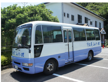
別荘地巡回無料バス