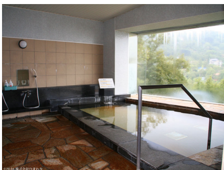
温泉大浴場【サウナ付き】