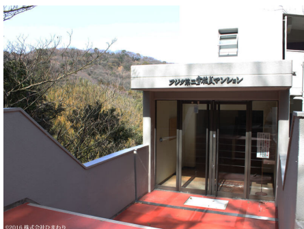
マンション専用入口