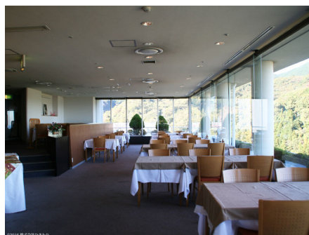
予約制 レストラン