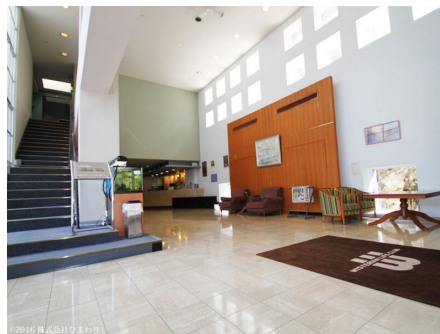
ホテル兼用ロビー