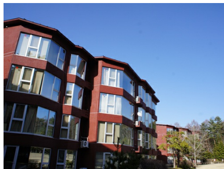
ゴルフ場側からの外観