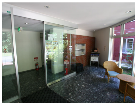
エントランス (1号棟)