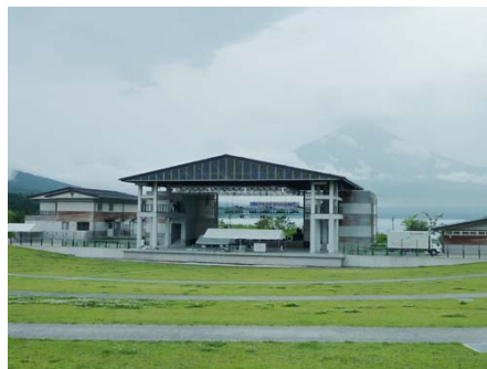
山中湖交流プラザきらら