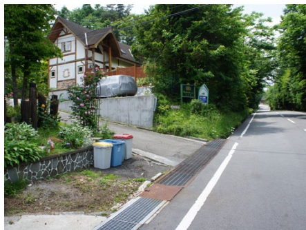
マンション入り口