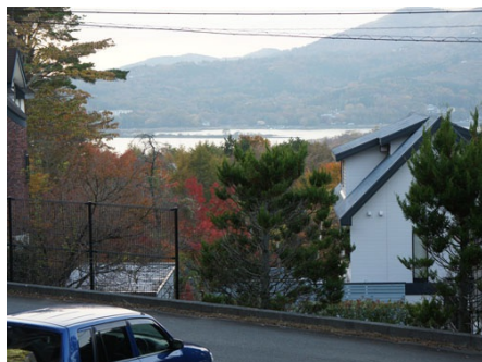
敷地内からの眺望（秋）