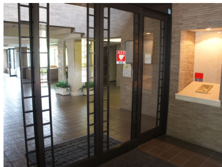
入口・オートロック