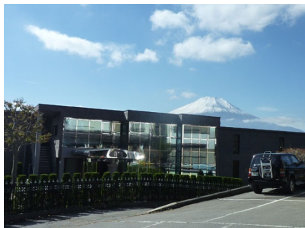
マンションと富士山