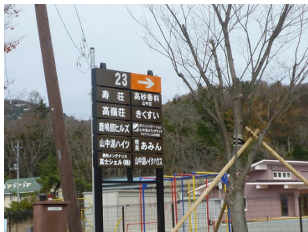
高速バス平野バス停