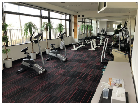
フィットネスルーム