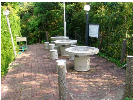
バーベキューガーデン