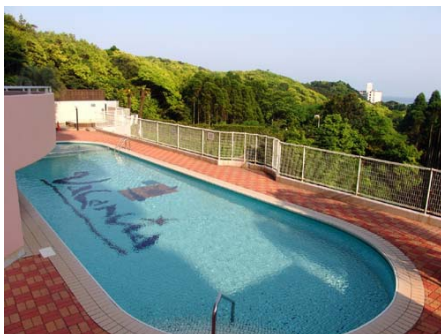
屋外プール(夏季営業)