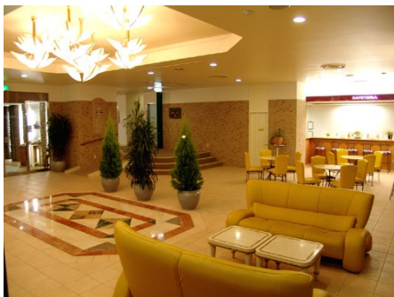
太平洋を臨む開放的なロビー