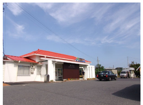
特急停車駅のJR外房線御宿駅(徒歩約5分)