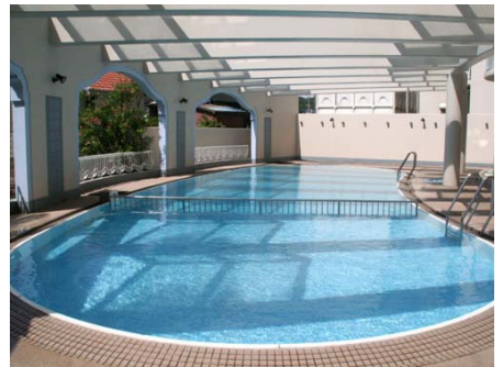
屋外プール(夏季営業)