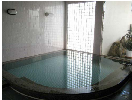
大浴場(サウナ付き)