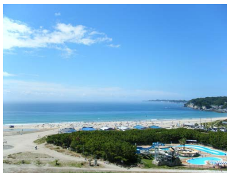
御宿中央海水浴場(徒歩約6分)