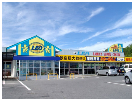
スーパーセンターレオ岬店(徒歩10分)