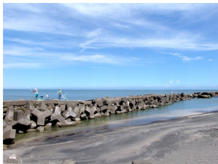
マンション近隣で釣りを楽しめます