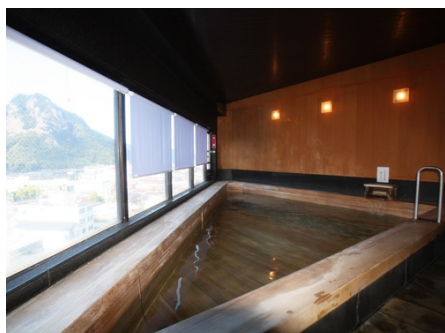
温泉大浴場（檜風呂）