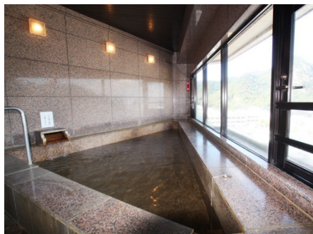
温泉大浴場（岩風呂）