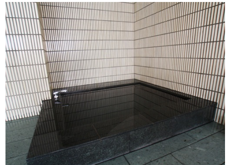
サウナ後は水風呂