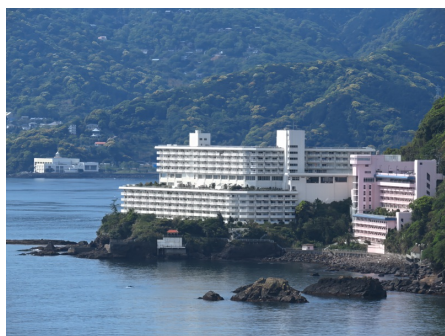
岬に沿って建つマンション