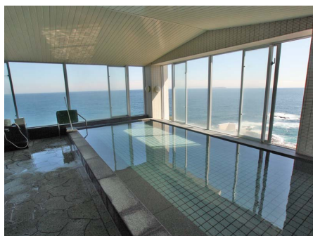
海を一望する温泉大浴場