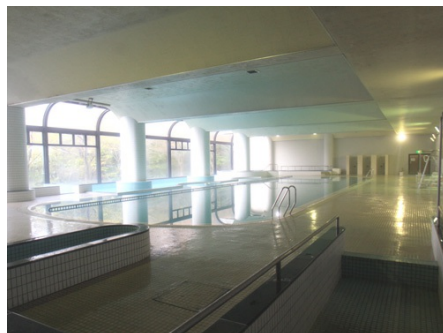
大きな室内プール