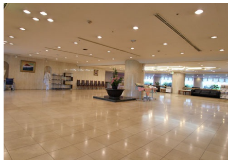
雰囲気の良いエントランス