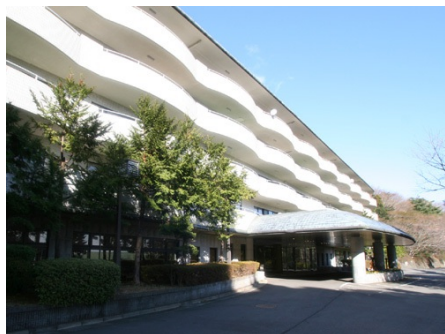
マンション入り口