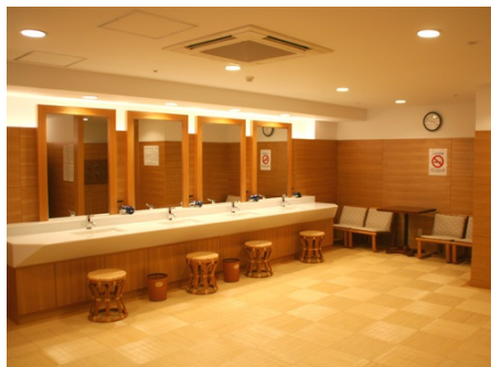
清潔に保たれた脱衣所