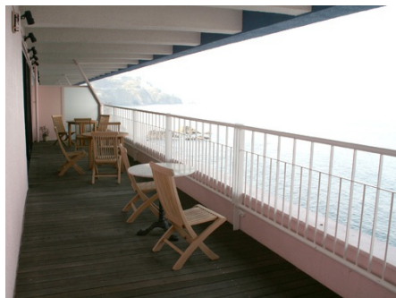
ウッドデッキテラス