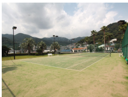
隣接：テニスコート