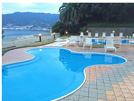
隣接：海風を感じる屋外プール