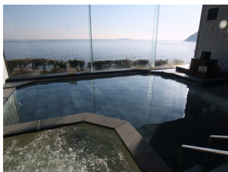
隣接：海目の前の温泉大浴場