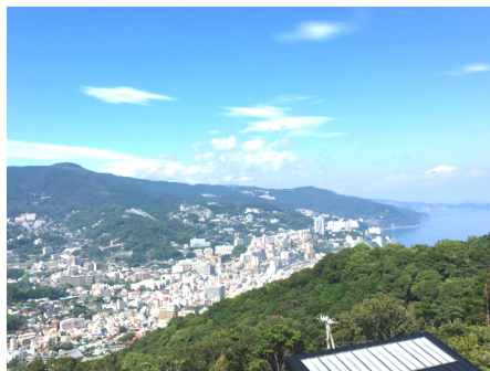
マンションからの眺望