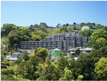
マンション外観 全景