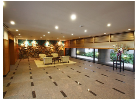
ホテル並みのロビー