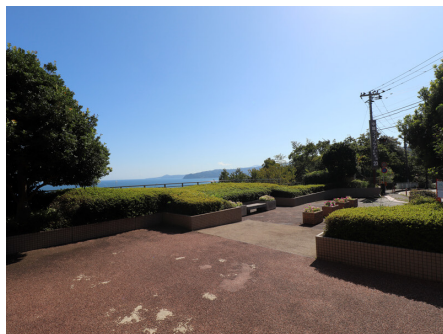
マンション入口前