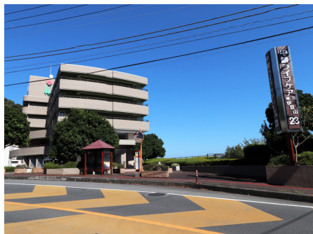
バス停目の前です