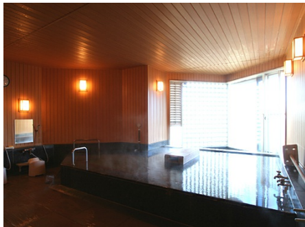
改修された温泉大浴場