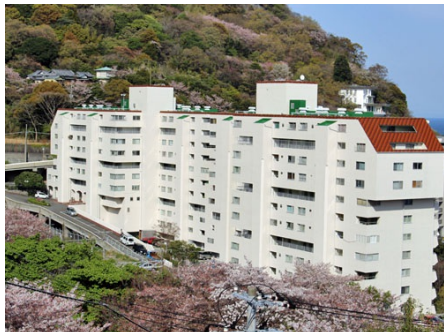
プラザ伊豆山外観