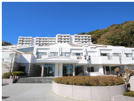
個性的なマンション外観