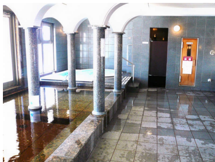
展望温泉大浴場とジャグジー