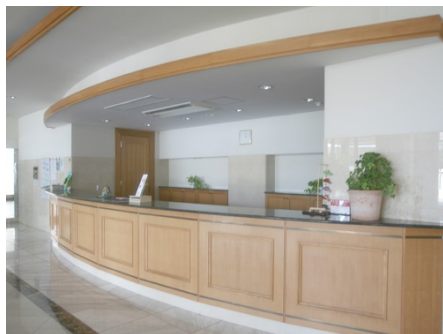
ホテルのようなフロント