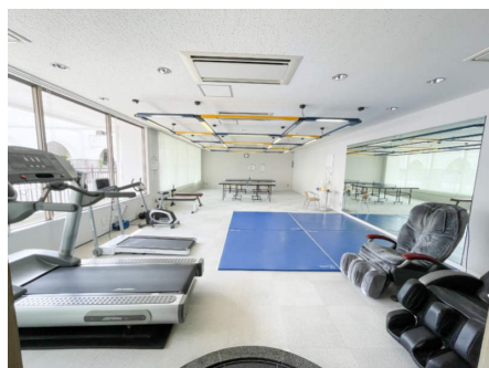
アスレチックルーム1