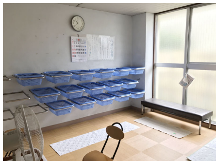
大浴場脱衣室（女湯）