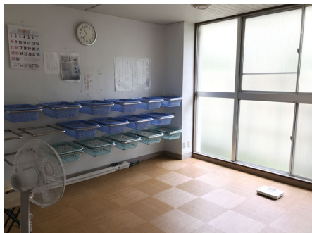
大浴場脱衣室（男湯）