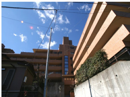
マンション外観 全景