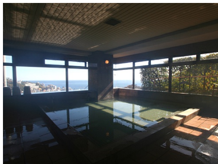
海一望の温泉大浴場（男性）