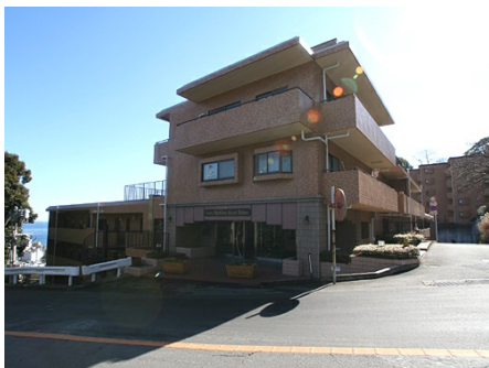
頼朝ライン沿いに立つ