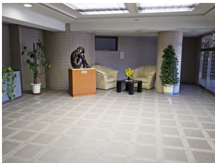
エントランスロビー