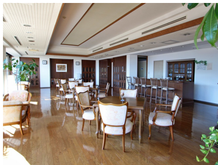
クラブハウス内ラウンジ