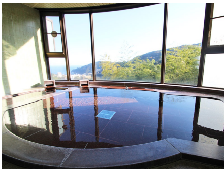
見晴らしの良い大浴場