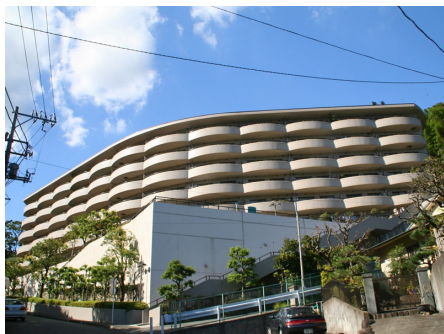
エムロード熱海 外観