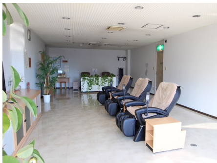
大浴場前のサロン