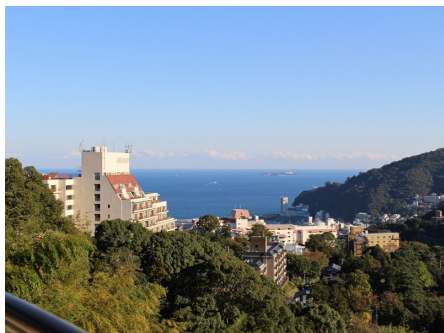
クラブハウスからの眺め（花火大会望む）