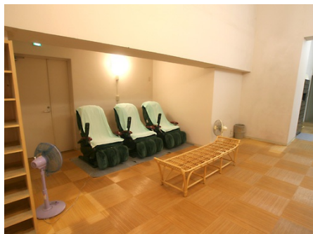
大浴場前にはマッサージ機