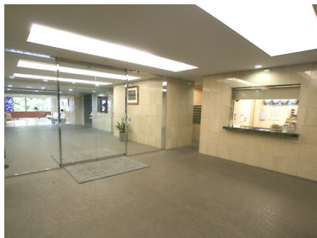
マンション入り口と管理人室