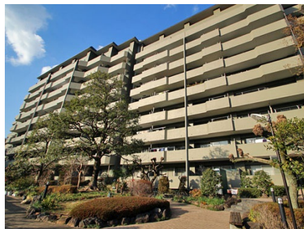
1階から見たマンション外観