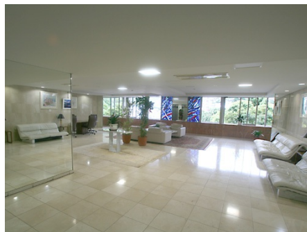
エントランスラウンジ